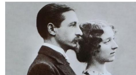
И. А. Бунин и В. Н. Муромцева