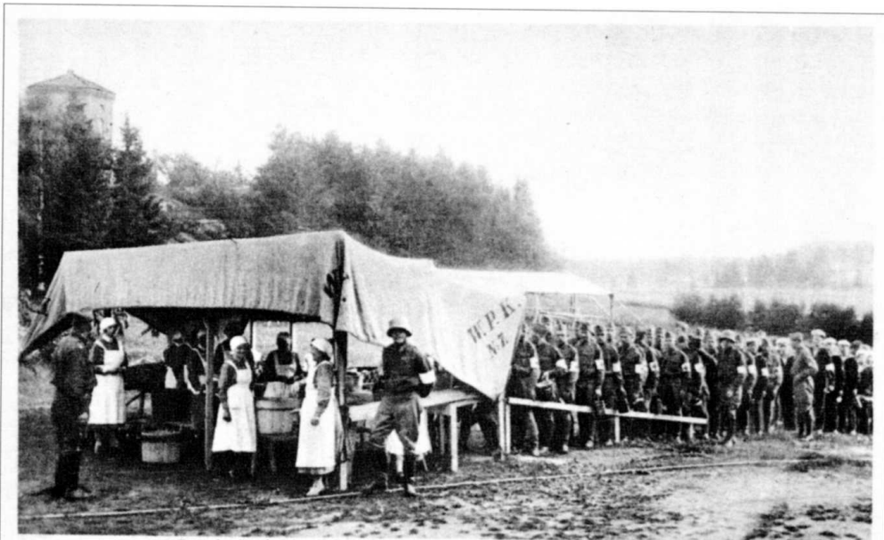
Ruokailujono leiripäivillä. — Matkõ under lägerdagar.