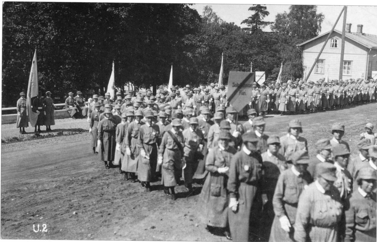
на фото: внизу - кафе "Лотта" в городском парке;верху - колонны лотт на Koulukatu (ныне ул. Гагарина). 1930-е гг.