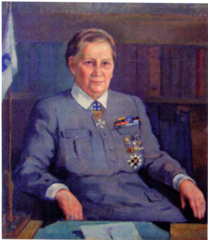
Единая форма одежды лотт с 1922г.