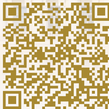
3D-тур по Президентской библиотеке

тел. (812) 334-25-14 e-mail: excursion@prlib.ru www.prlib.ru