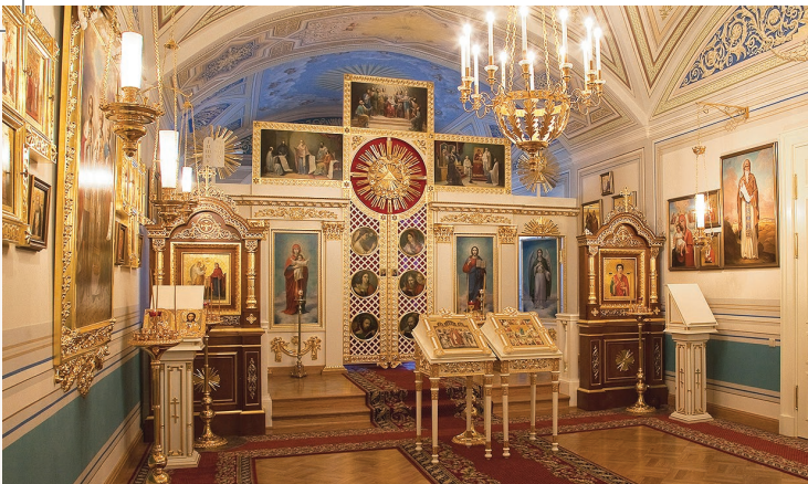
В храме сохранилась подлинная роспись плафона XIX века

В здании Синода располагается домовый храм Святых Отцов Семи Вселенских Соборов , его интерьеры воссозданы по архивным документам и фотографиям. Церковь действует, в ней проходят богослужения.