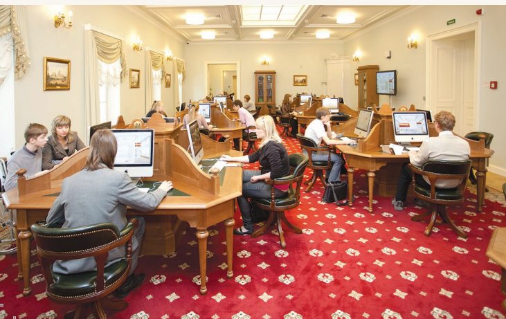
Посетители электронного читального зала работают с документами фонда Президентской библиотеки

Все желающие могут записаться в библиотеку.