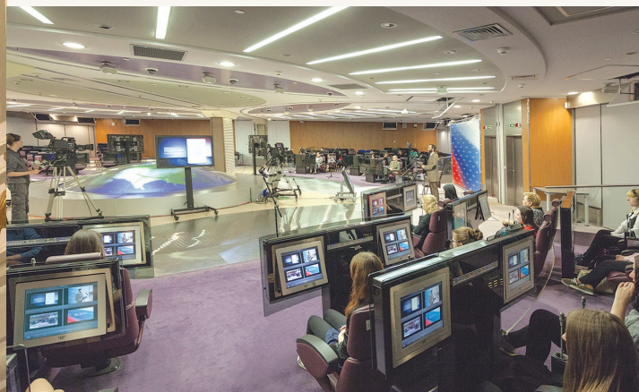
«Урок Конституции» способствует укреплению у школьников гражданской ответственности и патриотизма

Постоянная экспозиция зала Конституции рассказывает об истории конституционного развития России в XX столетии. Главный экспонат выставки – точная копия инаугурационного экземпляра Конституции Российской Федерации, подаренная главой государства в день открытия Президентской библиотеки 27 мая 2009 года.