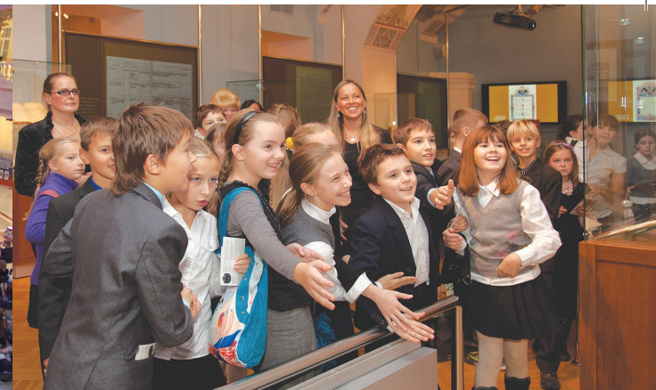
Дети знакомятся с электронными экспонатами выставки

Конференц-зал создан на месте бывшего внутреннего двора Синода. Интерьер зала-атриума выдержан в стиле классицизм. Техническое оснащение зала позволяет проводить торжественные мероприятия высокого уровня: межгосударственные встречи, международные и всероссийские форумы, конференции, симпозиумы, круглые столы, концерты.