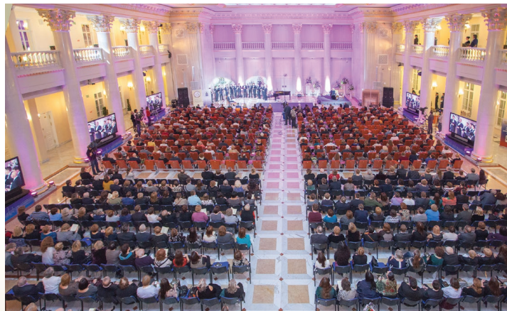
Концерт классической музыки в стенах Президентской библиотеки

Парадная лестница здания отличается строгостью как в декоре литой решетки, так и в росписи сводов, выполненной в технике гризайль.