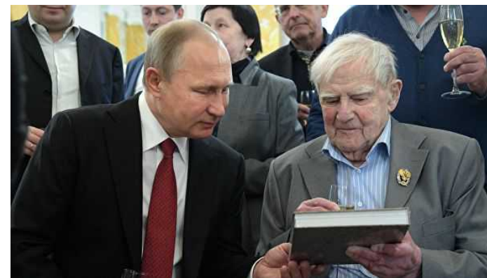
На фото: Даниил Гранин во время презентации своей книги "Причуды моей памяти"

В течение долгого времени Гранин занимался общественной деятельностью , участвовал в международных встречах и симпозиумах, посвященных науке, экологии и литературе. Писатель Даниил Гранин скончался 4 июля в Санкт-Петербурге - городе, в котором он прожил всю свою жизнь.