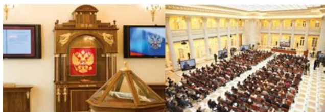
Президентская библиотека имени Б. Н. Ельцина