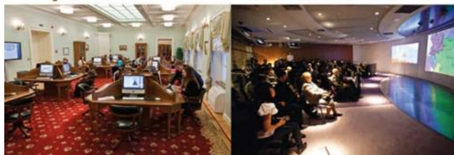
Залы Президентской библиотеки